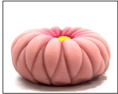
三角ベラ花びら（側面）