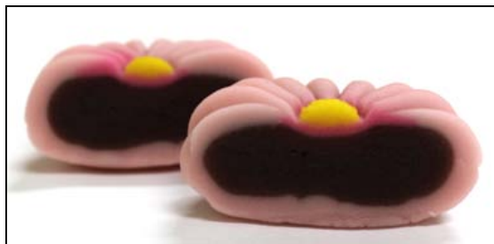
練り切り（へら菊）断面