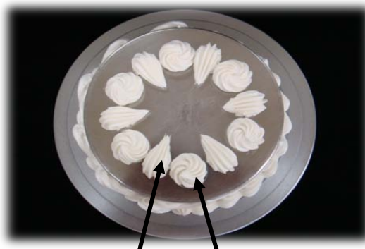
シェル絞り ローズ絞り