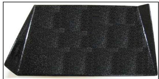
菓子盆（27.5cm×19.5cm 陶器製角プレート）