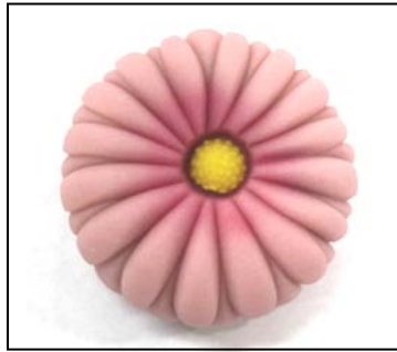
三角ベラ花びら（上面）