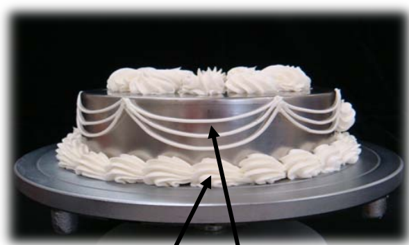
下面 シェル絞り 側面 パイピング